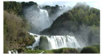
Cascata delle Marmore